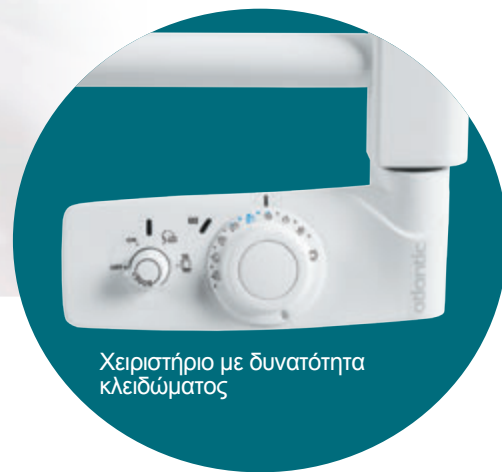
Χειριστήριο με δυνατότητα κλειδώματος